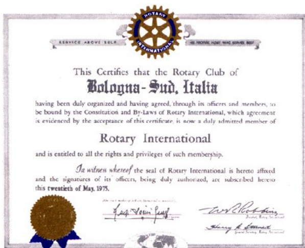
documento costitutivo del Club datato 20 maggio 1975