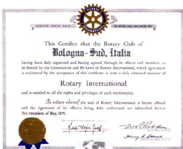
documento costitutivo del Club datato 20 maggio 1975