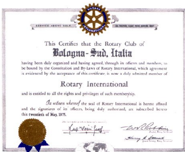
documento costitutivo del Club datato 20 maggio 1975