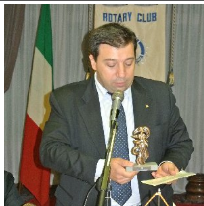
La gratitudine del Club di Cento per il nostro intervento pro terremotati