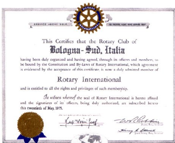
documento costitutivo del Club datato 20 maggio 1975