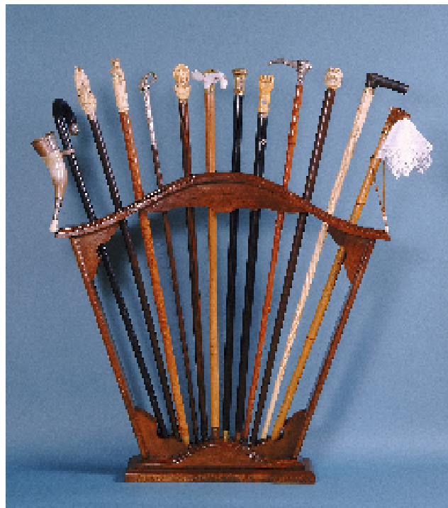
DA "L'INCREDIBILE MONDO DEL BASTONE"