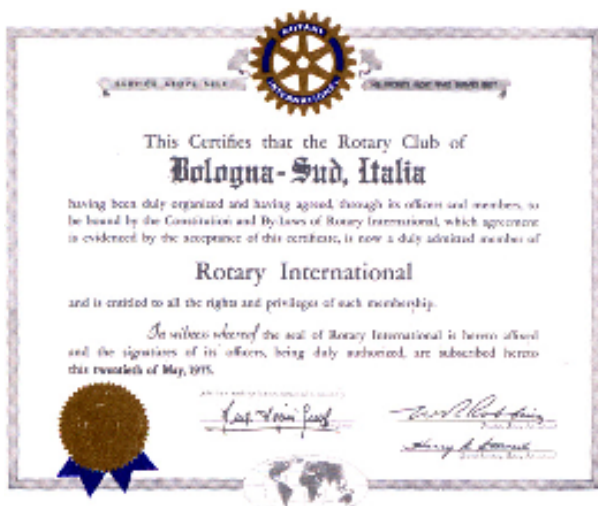
documento costitutivo del Club datato 20 maggio 1975