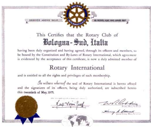
documento costitutivo del Club datato 20 maggio 1975