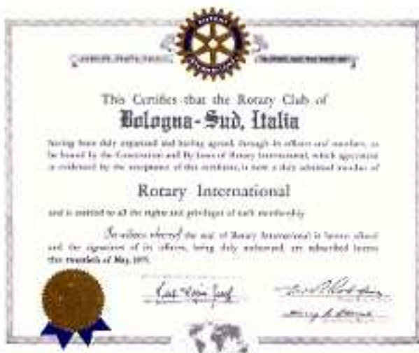
documento costitutivo del Club datato 20 maggio 1975