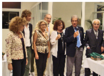
Due belle Famiglie: i Maresca e i Fiorentino