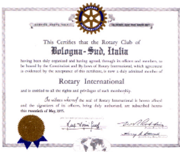
documento costitutivo del Club datato 20 maggio 1975