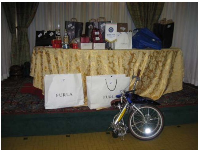
un vero monte premi, anzi una montagna!

Non certo da meno tutte quelle amiche, CONSORTI E NON che si sono prestate a rifocillare gli intervenuti con le loro preziose qualità culinarie: