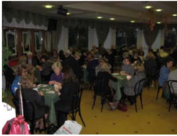
alcuni dei concorrenti in gara