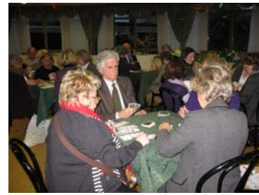
la miglior coppia rotariana