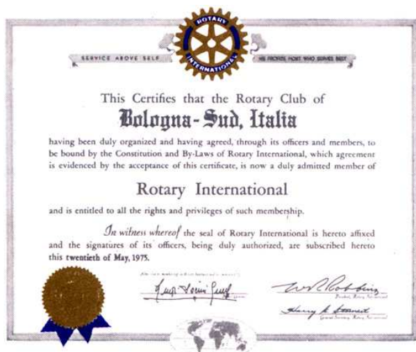
documento costitutivo del Club datato 20 maggio 1975