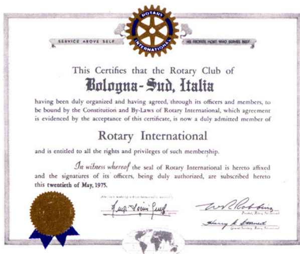
documento costitutivo del Club datato 20 maggio 1975