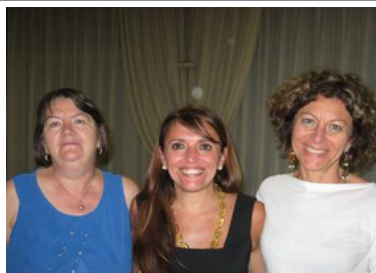
Lo staff del Past President