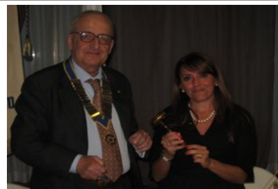
Il tradizionale martelletto d'oro