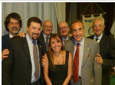
Il C.D. uscente, quasi al completo