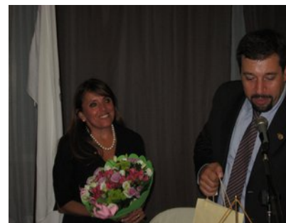
L'omaggio del Past